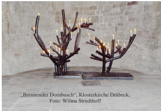
„Brennender Dornbusch“, Klosterkirche Drübeck, Foto: Wilma Strudthoff